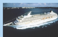
クリスタル・シンフォニー