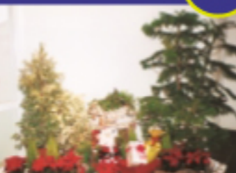
前年のクリスマスデコレーション風景