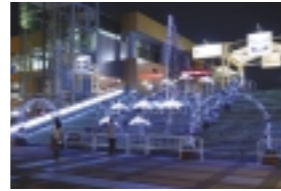
天保山ハーバービレッジ